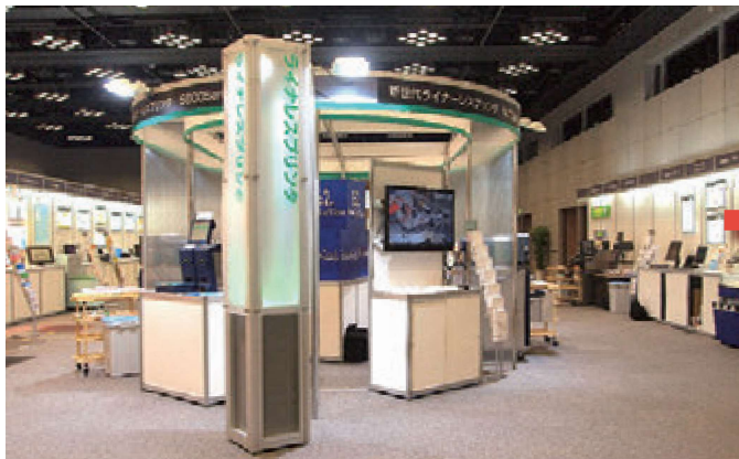
■寺岡精工様 大阪個展(2013年06月)