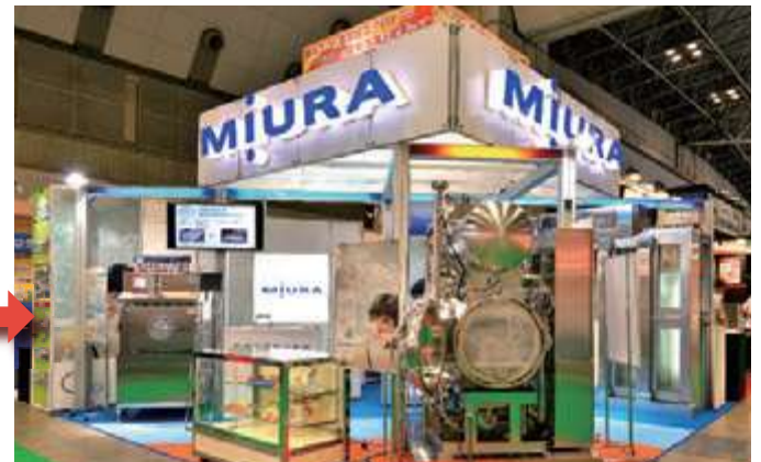
■FOOMA JAPAN 2013(2013年06月)