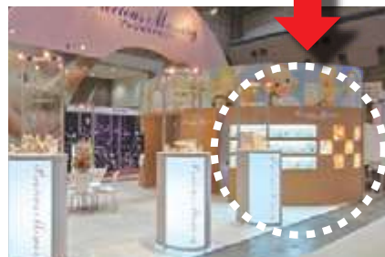
■ショーウィンドー変更によるブースの再使用例

展示ブースを再使用しながら、展示内容に合わせたカスタマイズ部材の追加、ロケーションやレギュレーションに合わせたデザイン変更が可能です。