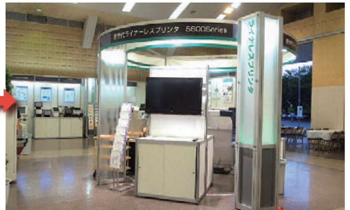
■寺岡精工様 長野個展(2013年07月)

SRDS 2 のお問い合わせ 東京本部 03-5646-1160 大阪本社 06-6624-3601 企画営業本部まで