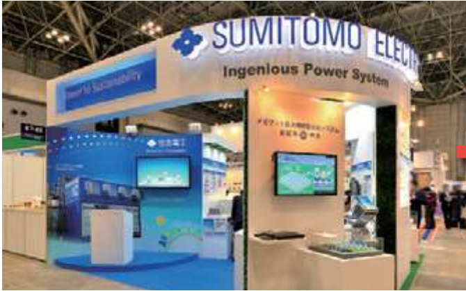
■(国際)スマートグリッドEXPO(2013年02月)