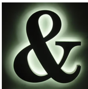
バックライトチャンネル

バックライト（LED）で壁面を光らせることで、チャンネル文字の輪郭を浮かび上がらせます。間接照明のような上品な印象を与えることができます。