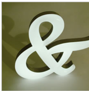
縁なし内照式文字

カップリング文字の押さえ縁なしタイプです。表面をアクリルのみで表現することで、今まで難しかった小さな文字も対応する事が可能になりました。