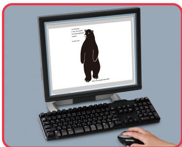
① パソコンでデータ作成