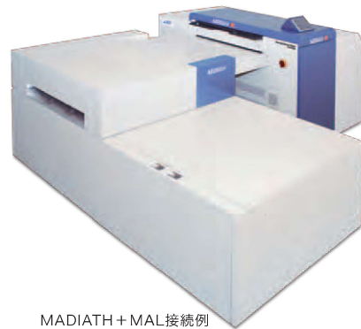
MADIATH + MAL接続例

菊半裁判以下の小ロット印刷に対応するため、64チャンネル光源の露光ヘッドを搭載し、33版/時の高生産性。