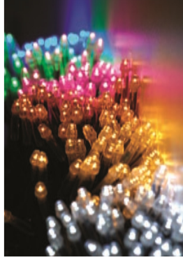
白・電球・キャンドル・青色など