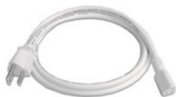
100V入力パワーコード (L1000)