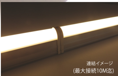
連結イメージ (最大接続10M迄)