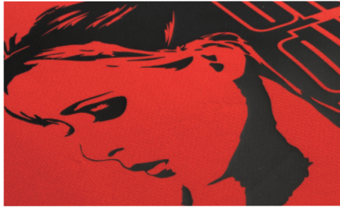
※メートル単価 A3換算 ¥250～