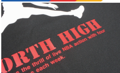
※メートル単価 A3換算 ¥246～