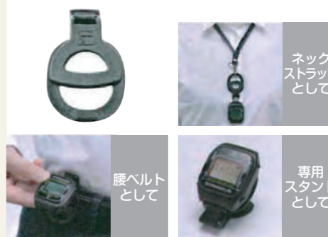
ネックストラップとして

腕時計型受信器のベルトをホルダーに変えると、1つのホルダーで様々な使い方ができます。