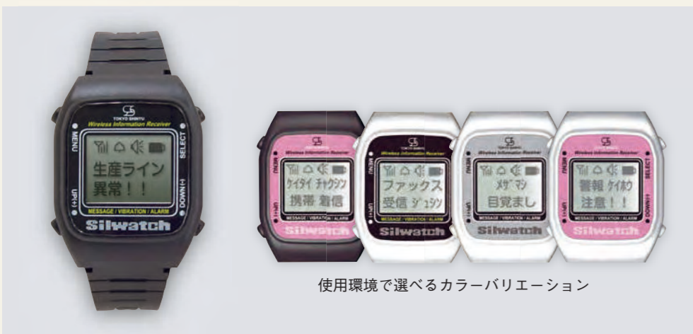
使用環境で選べるカラーバリエーション